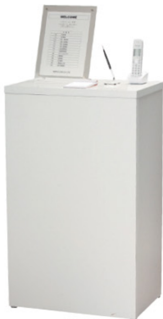
MUD-640 JAN 089804